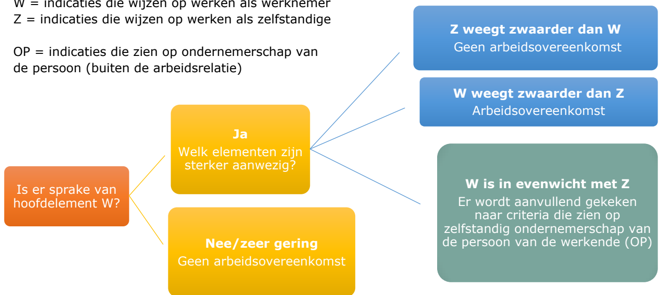
Figuur 3. Schematische weergave van de beoordeling van 'werken in dienst van' volgens het voorstel

OP = indicaties die zien op ondernemerschap van de persoon (buiten de arbeidsrelatie)