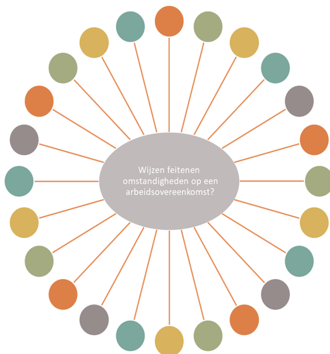
Figuur 2. Schematisch weergegeven diversiteit aan (mogelijk) relevante feiten en omstandigheden die momenteel betrokken kunnen worden bij de beoordeling van een arbeidsrelatie.

Hoewel het in een grote meerderheid van de situaties duidelijk is of iemand als werknemer het werk hoort te doen, of als zelfstandige het werk kan doen, geldt dat niet voor alle gevallen. Zeker als er persoonlijk werk verricht wordt voor een zakelijke opdrachtgever kan er twijfel ontstaan of er sprake is van een arbeidsovereenkomst of een overeenkomst van opdracht of overeenkomst van aanneming van werk.